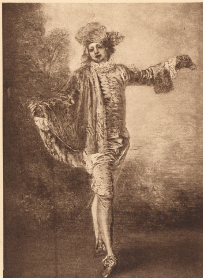
WATTEAU — L'INDIFFÉRENT

LIBRAIRIE-PAPETERIE M lles BARRUCAND 8, Rue Notre-Dame ANNECY