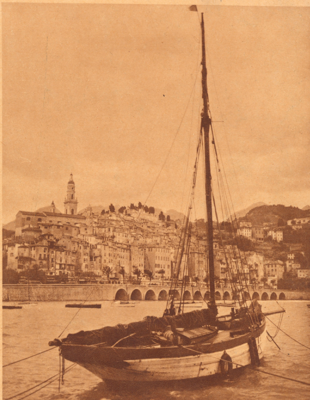
Menton. La baie de Garavan.