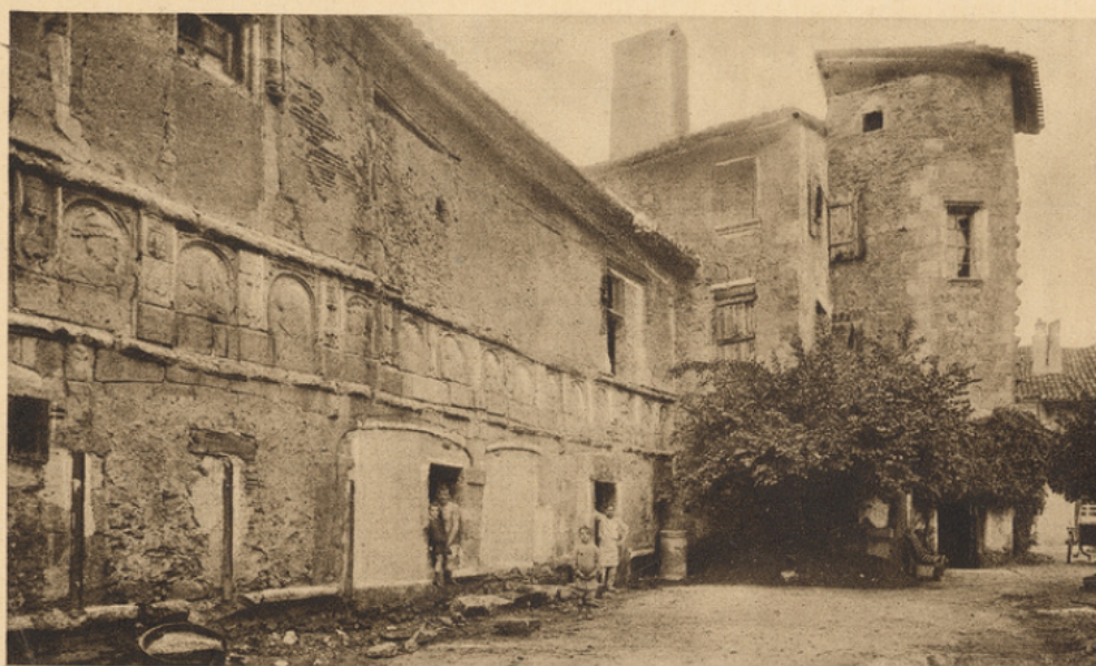
CHATEAU DE CASTELJALOUX (L.-et-G.). — Ce Château fut construit par la Maison d'Albret. Ce fut, en particulier, la résidence de Jeanne d'Albret, mère du roi Henri IV.