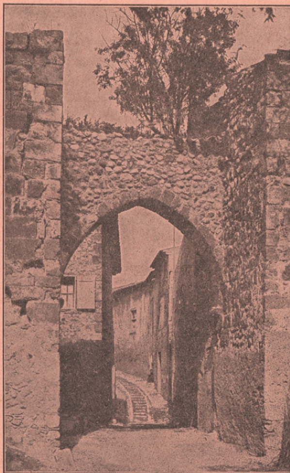
PORTAIL DE PUIMOISSON