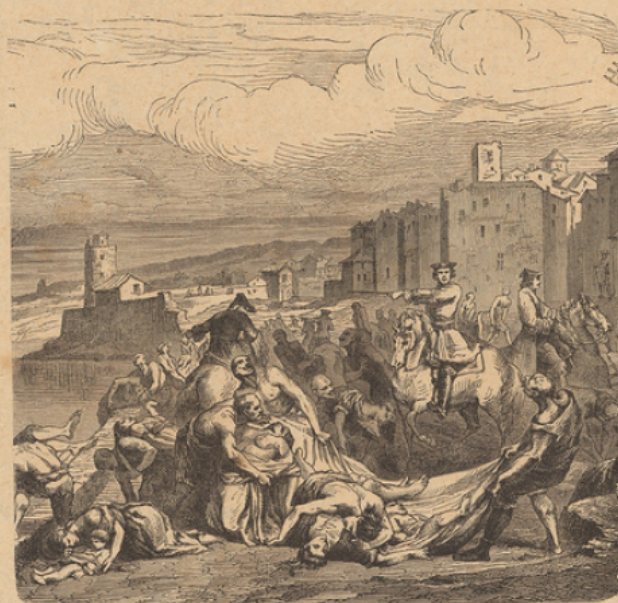
Le chevalier Roze à Marseille.

La banque de Law, combinée avec la Compagnie des Indes occidentales, qui était une vaste entreprise commerciale, eut d'abord un succès énorme (1719). Law était adoré comme un Dieu par ceux que son système avait enghiés : tout le monde se disputait le papier de sa banque et les actions de sa compagnie de commerce; les actions étaient tellement recherchées qu'on les payait jusqu'à quarante fois leur valeur, 20 000 livres au lieu de 500. Le siège de la banque se trouvait rue Quincampoix; la foule des agi-geurs s'y étouffait, et un petit bossu gagna, dit-on, 150 000 livres à prêter son dos en guise de pupitre.