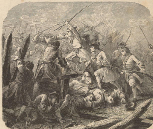
Victoire de Denain.

Après la bataille d'Oudenarde, le prince Eugène vint assiéger Lille à la tête de 55 000 hommes et de 200 canons (août 1708). Boufflers, avec 10 000 soldats seulement et quelques milliers d'habitants, défendit pied à pied tous les ouvrages extérieurs de la place, et fit plusieurs sorties qui jetèrent le désordre dans les batteries ennemies, mais au bout de deux mois la garnison, réduite de moitié, était à bout de force, les murailles battues en brèche s'écroulaient de toutes parts. Boufflers capitula pour la ville, se retira dans la citadelle, et n'en sortit qu'au mois de décembre, avec les honneurs de la guerre.