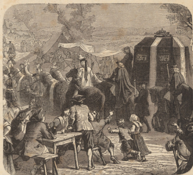
Enterrement de Louis XIV.

Fénelon avait été le précepteur du duc de Bourgogne, Louis, petit-fils de Louis XIV; c'était pour son élève qu'il avait composé le Télémaque . Nommé archevêque de Cambrai en 1695, il édifica tout le monde par sa douceur évangélique, par sa charité et par son infatigable dévouement: il visitait les malades, les pauvres, les malheureux; sa bonté lui faisait trouver des consolations pour toutes les misères. Pendant la guerre de la succession d'Espagne il fit de l'évêché une vaste ambulance, où il soigna lui-même les blessés.