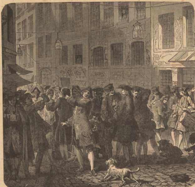
La rue Quincampoix, siège de la banque de Law.

Marie Leszcinska était fille de Stanislas Leszcinski, ancien roi de Pologne, qui vivait obscurément en Alsace. Mariée à Louis en 1725, elle fut très malheureuse.