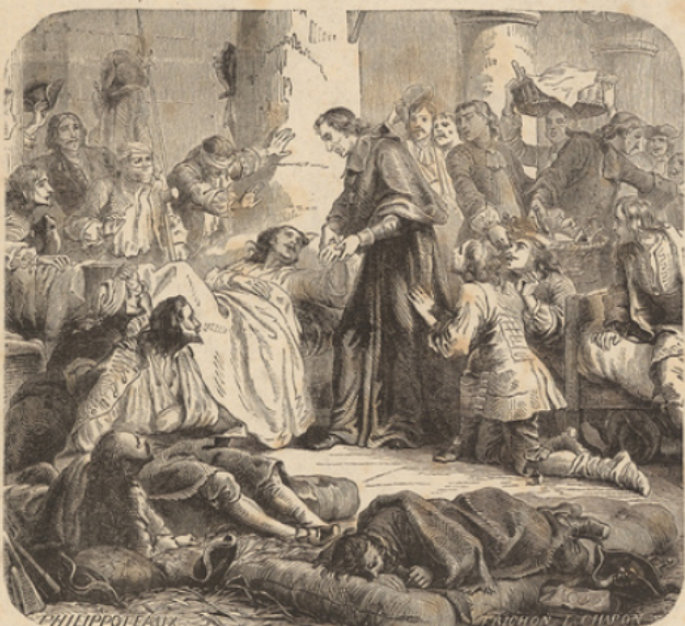
Fénelon soignant les blessés.

Denain fut un éclatant retour de fortune. Le prince Eugène avait plus d'hommes que Villars, mais ses forces étaient disséminées de la Sambre à l'Escaut. Villars, après avoir trompé l'ennemi par d'habiles manœuvres, se porta rapidement avec toutes ses forces contre le camp retranché de Denain, l'emporta d'assaut sous un feu effroyable, y détruisit 8000 hommes et y prit soixante drapeaux. Le reste des ennemis arrivèrent au bruit du canon, mais ils trouvèrent le camp au pouvoir des Français et furent contraints de se retirer; la victoire n'avait pas coûté à Villars plus de 500 hommes (24 juillet 1712).