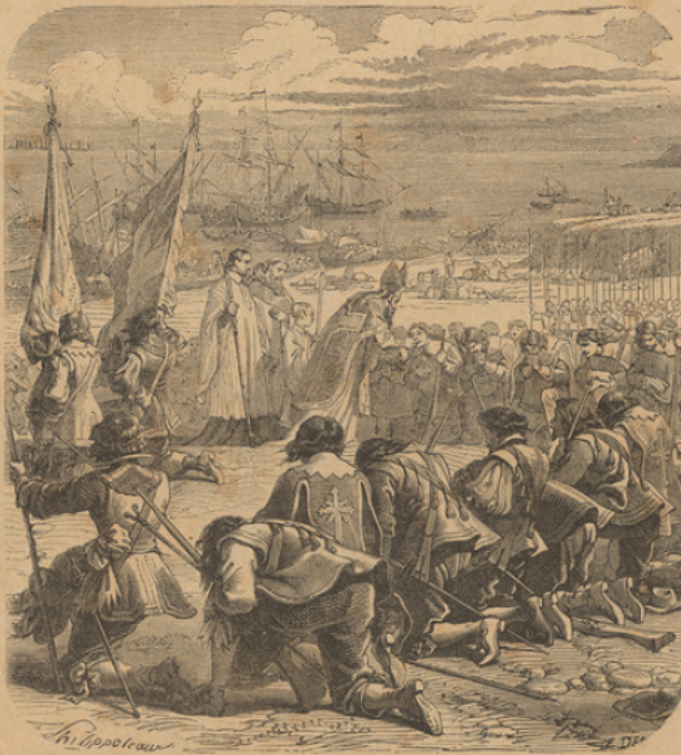
Les Français communient avant de combattre.

Maréchal de France en 1625, Schomberg chassa les Anglais de l'île de Ré, servit avec gloire au siège de la Rochelle, puis dans la guerre contre la Savoie, et mourut en 1652, après avoir vaincu Montmaurency.