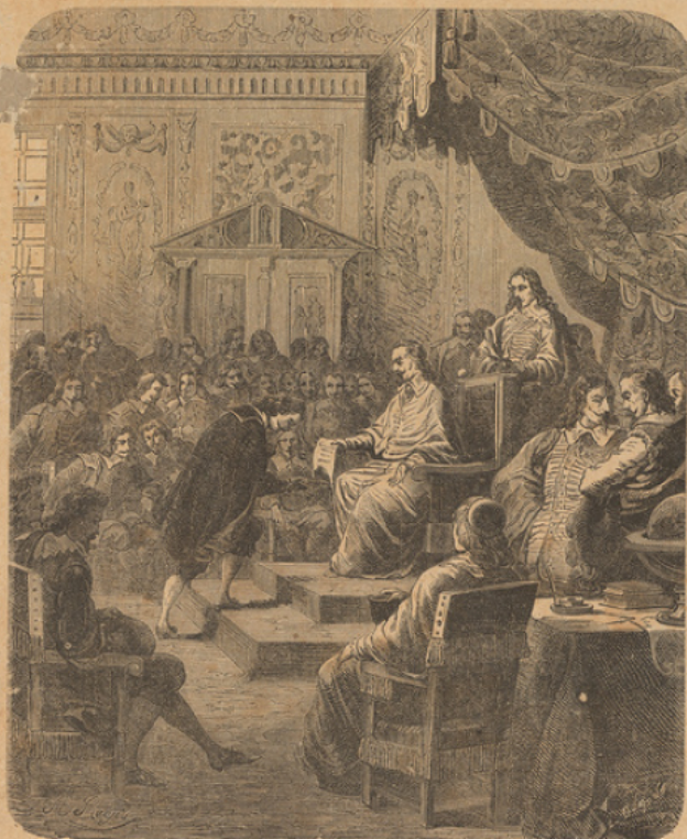
Installation de l'Académie française par Richelieu.

Richelieu avait lui-même une espèce de premier ministre : c'était un capucin, appelé le père Joseph, et surnommé l'Éminence grise. Très instruit et très habile, le moine rendit de grands services à la France.