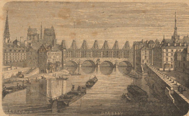
Le Pont Saint-Michel sous Louis XIII.