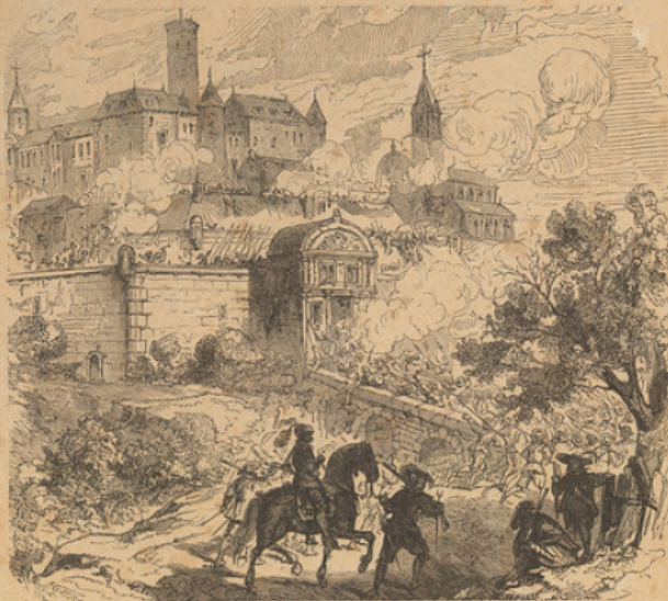
Prise de Pignerol.

Le duc de Savoie, qui cherchait à s'agrandir du côté de la France, s'était allié à l'Espagne; mais Richelieu et Louis XIII traversèrent les Alpes au Mont-Genève malgré la glace et la neige (1 er mars 1629), débâtlèrent l'ennemi du Pas de Suse, défilé étroit et fortifié qui semblait imprenable, et poursuivirent les fuyards, l'épée dans les reins, jusqu'à Suse (6 mars). Le duc de Savoie fut contraint à traiter.