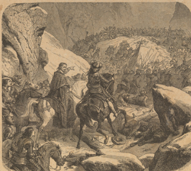
Le Pas de Suse.

Malheureusement il est forcé d'ajourner la vraie guerre pour se tourner contre les grands et contre les protestants français; il signe même avec l'Espagne catholique un traité qui le brouille avec l'Angleterre protestante.