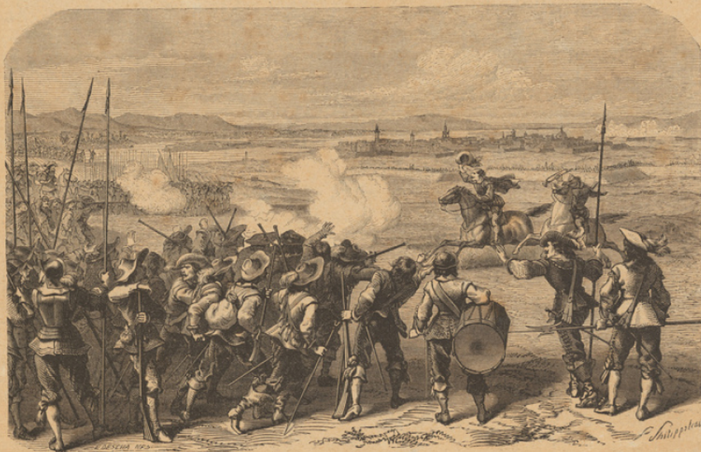
Mazarin à Casal.

expéditions contre la Savoie pour la contraindre à l'alliance française : la première fois il force brillamment le Pas de Suze (1629), la deuxième, il s'empare de Pignerol, porte de l'Italie (1630), et fait occuper la Savoie.