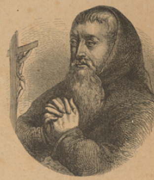
Le Père Joseph.

L'activité de Richelieu n'est pas tout entière employée à l'abaissement des grands, des protestants et de l'aristocratie. Il ramène l'économie dans les finances, seconde le développement du commerce et de la richesse publique, commence à organiser une marine de guerre, enfin favorise les sciences par la création du Jardin des Plantes (1626), et les lettres par la fondation de l'Académie Française (1635).