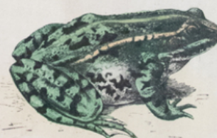
GRENOUILLE VERTE ( Rana esculenta ) (Europe)