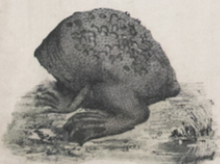
PIPA ( Pipa americana ) (Brazill)