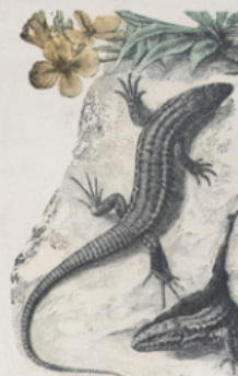
LÉZARD ( Lacerta muralis ) (Europe)