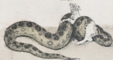
BOA ( Eunectes murinus ) (Brazill)