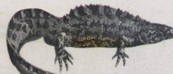
TRITON ( Triton cristatus ) (Europe)

Musée Scolaire. — Les Fils D'Émile Deyrolle, 46, rue du Bac, Paris.