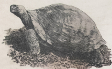
TORTUE TERRESTRE ( Testudo nigruta ) (Des Galapagos)