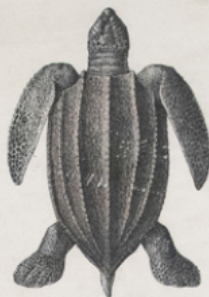
TORTUE DE MER ( Sphargis coriacea ) (Océan Atlantique)