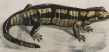
SALAMANDRE ( Salamandra maculosa ) (Europe)