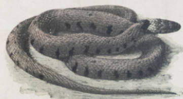
COULEUVRE ( Tropidonotus natrix ) (Europe)