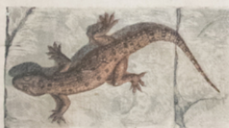
HÉMIDACTYLE ( Hemidactylus verruculatus ) (Europe)