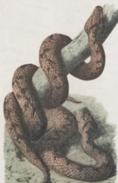
VIPÈRES ( Vipera aspis et berus ) (Europe)