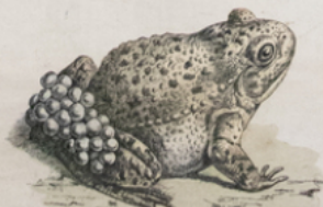
ALYTE ( Alytes obstetricans ) (Europe)