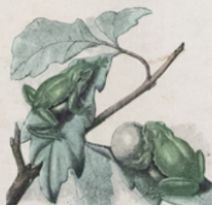
RAINETTE ( Hyla viridis ) (Europe)