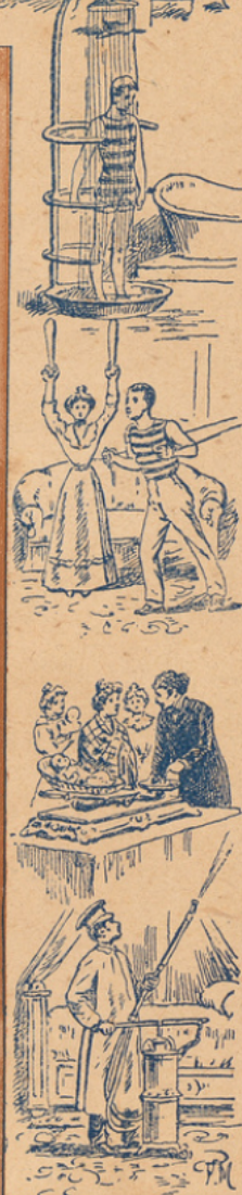
N° 16. — L'hygiène publique. — Le vaccin.