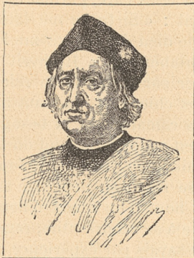
COLOMB ( Christophe ), navigateur génois. Entré au service de l'Espagne, il découvrit l'Amérique, et mourut à Séville. (1436-1506.)