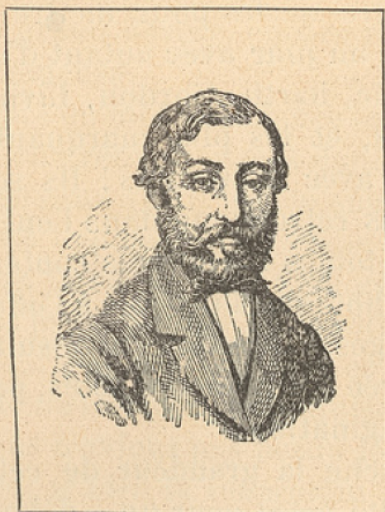
CAILLÉ ( René ), voyageur français; le premier Européen qui pénétra en Afrique jusqu'à Tombouctou. (1799-1838.)