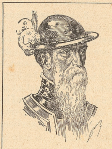
PIZARRE ( François ), aventurier espagnol qui conquiert le Pérou et fut tué à Cuzco par les partisans d'Almagro. (1475-1541.)