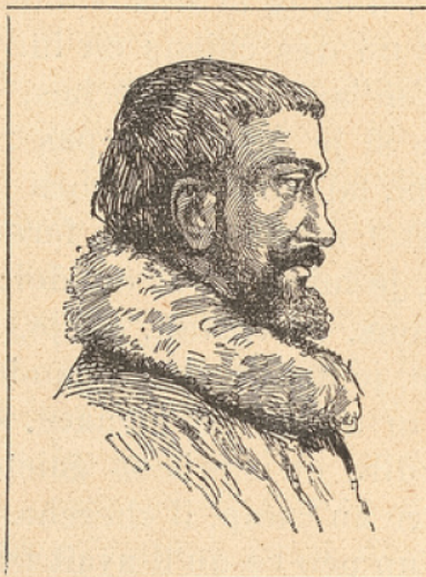
MAGELLAN, navigateur portugais; découvrit le détroit qui porte son nom. Il fut tué aux Philippines. (1470-1521.)