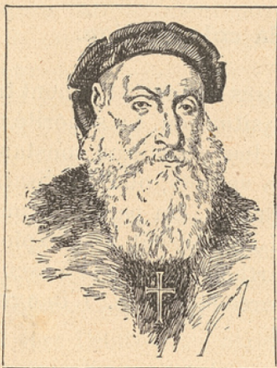
GAMA ( Vasco de ), navigateur portugais; découvrit la route des Indes par le cap de Bonne-Espérance. (1469-1524.)