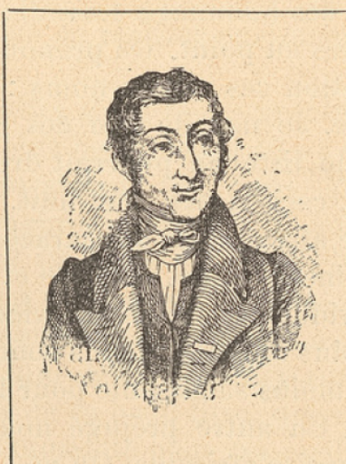
BARTH ( Henri ), explorateur de l'Afrique centrale; né à Hambourg. Il parcourut l'Égypte, l'Afrique, etc. (1821-1865.)