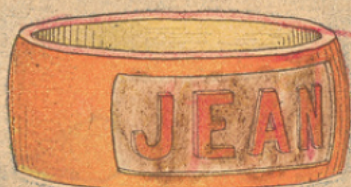
1. Rouleau de Serviette.