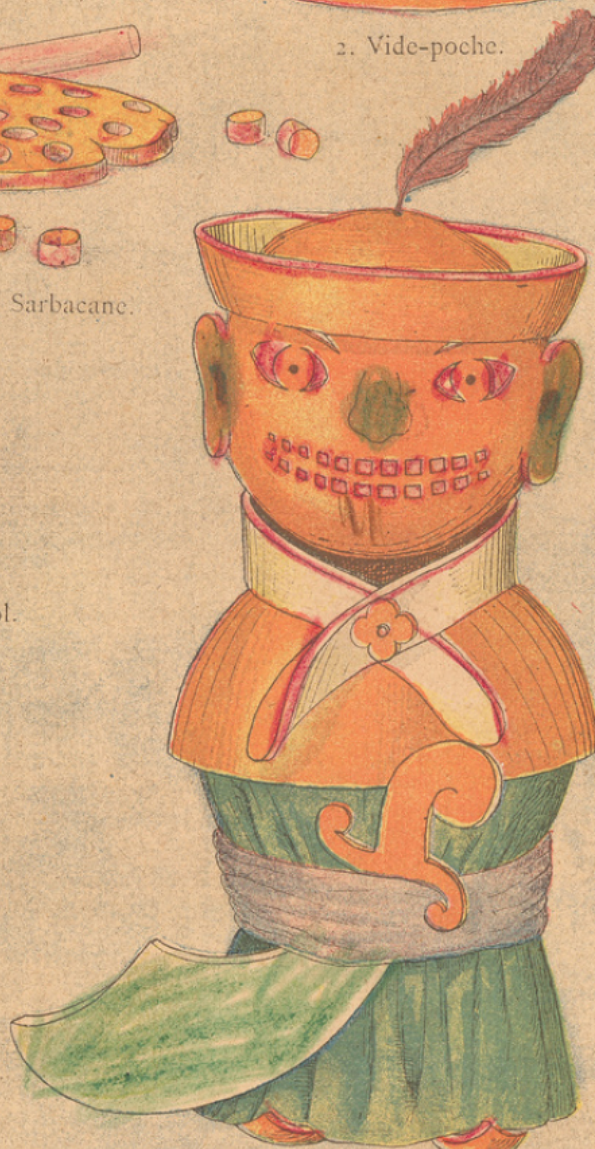
6. Pirate tonkinois.