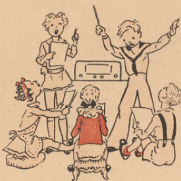
illustration) d' H. Tournier