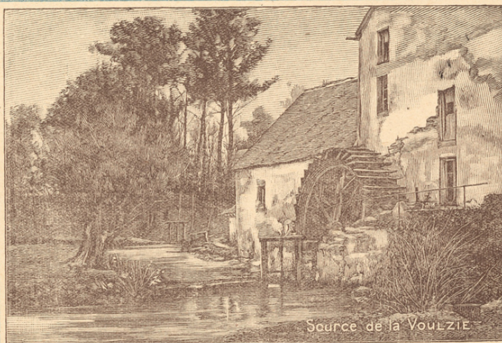
Source de la VOULZIE