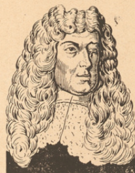
Le Nôtre (André) 1613-1700 Célèbre Architecte de jardins

Néanmoins beaucoup sont encore en service après un séjour de plus de 200 années dans le sol, la fonte étant par excellence le métal qui convient le mieux pour les canalisations souterraines.