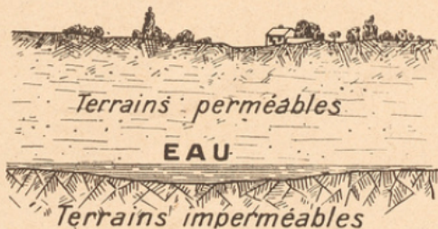
Coupe théorique de la formation d'une nappe souterraine

1° Une partie retourne dans l'atmosphère par évaporation, ou est absorbée par les plantes, dont elle constitue une partie de la nourriture.