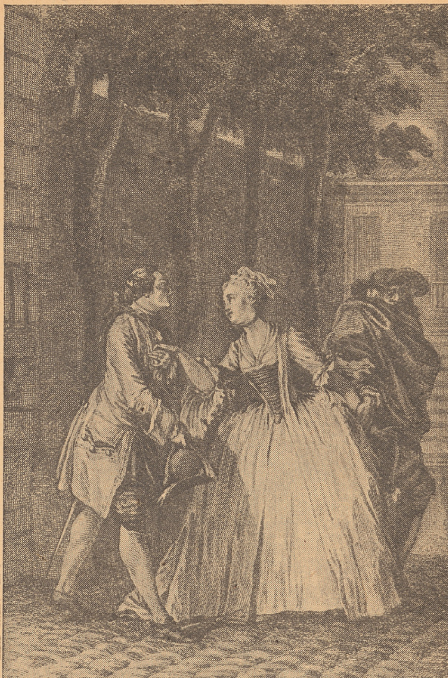
Dessin de Moreau le Jeune pour l'édition du Théâtre de Molière ; Paris, 1773.