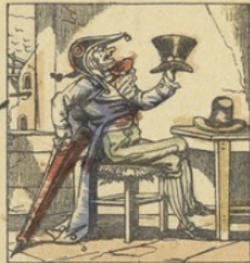
Cadet Rousselle a trois chapeaux.