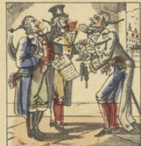
Cadet Rousselle a trois deniers.

— 1 — Cadet Rousselle a trois maisons (b4a) Qui n'ont ni poutres ni chevrons : (b4a) C'est pour loger les hirondelles ; Que direz-vous d'Cadet Rousselle? Ah! ah! ah! mais vraiment, Cadet Rousselle est bon enfant.