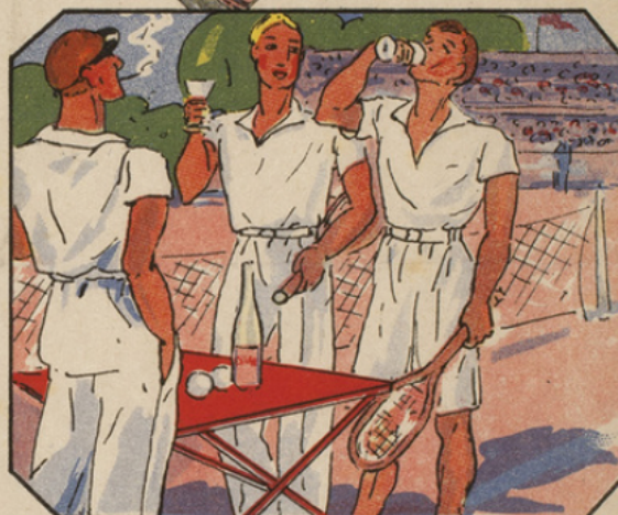
Au Championnat International de Tennis, entre deux Sets, les champions se rafraîchissent avec une délicieuse Évian-Cachat .