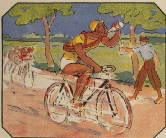
Les géants de la route, malgré leur soif ardente, évitent les eaux douteuses et attendent avec impatience le quart bien frais d' Évian-Cachat que leur passe le ravitailleur.