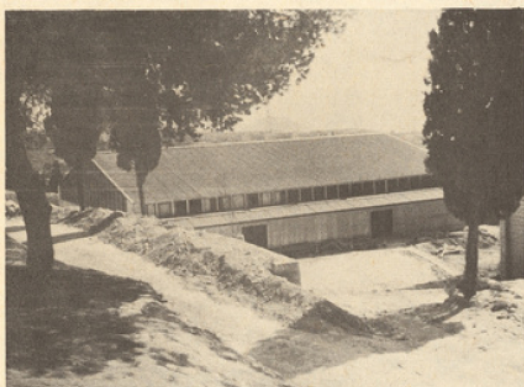
Atelier de mécanique - Workshop for mechanics