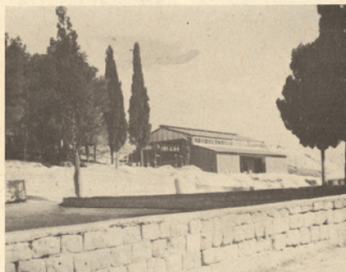
Atelier de soudure - Welding shop