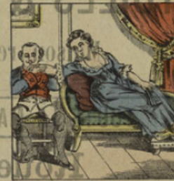
Pour se venger, Colombine favorise M. Mignolet.