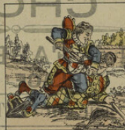
Polichinel se bat avec Arlequin.