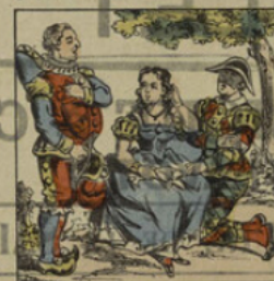
Il déclare sa flamme à Colombine, qui lui préfère Arlequin.