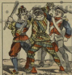
Polichinel et Arlequin rossent le quel.