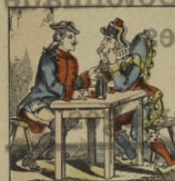
Mignolet raconte sa bonne fortune à Polichinel qu'il ne connaît pas.