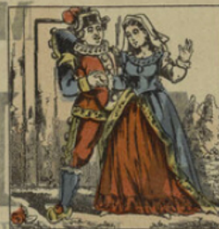
Amour de Polichinel.