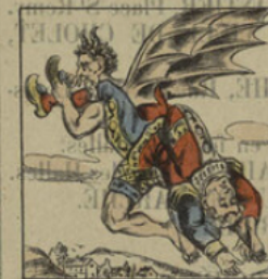
Le diable emporte Polichinel.