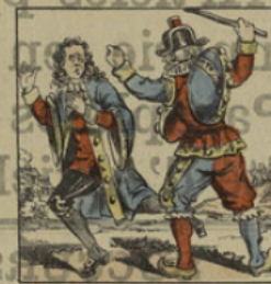
Il rossé le commissaire.