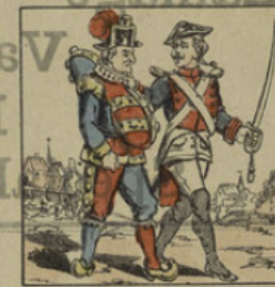
On conduit ce scélérat en prison.