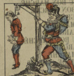
Il pend le bourreau à sa place.