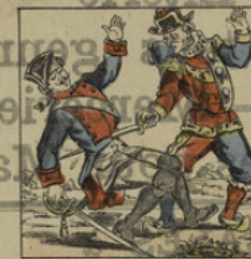
Duel de Polichinel et de Mignolet.