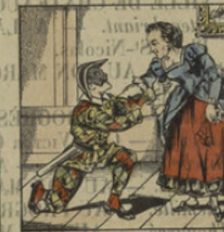
Sa veuve inconsolable épouse Arlequin.