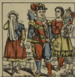
Il fait des malheureuses.