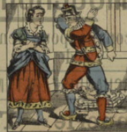
Il soufflette sa femme qui lui réclame son enfant.