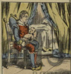
Naissance de Polichinel.