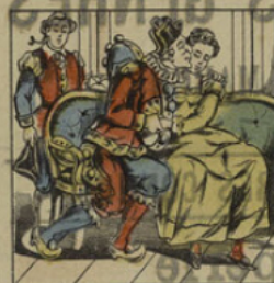
La lune de miel.