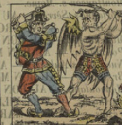
Bataille de Polichinel avec le diable.