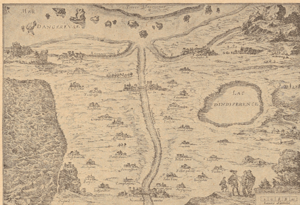
LA CARTE DU TENDRE

dressée par Magdeleine de Scudéry et publiée dans son roman de Clélie (1656-1660).