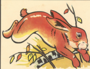
ja not la pin