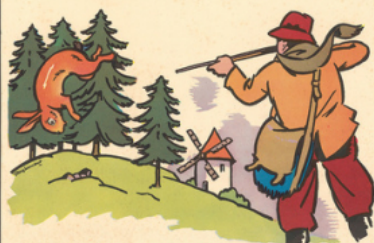
an to nin a tu é ja not la pin

ja noi la pin les la pins dan sent la ron de dans le bois de sa pins - ja not s'é cha ppe - où vas - tu ? de man de le din don - le pin son dit : mé fie - toi, an to nin