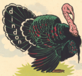
un din don

un pin - du vin - du lin - un pépin le ma tin - le che min - un ga min