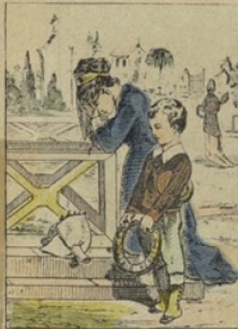
PLANCHE N. 112.