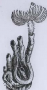
Fig. 183. — Appareil respiratoire chez les Serpules.