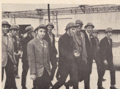
En route pour la visite d'Usinor