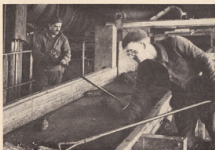
Charbonnages d'Oignies : point 10