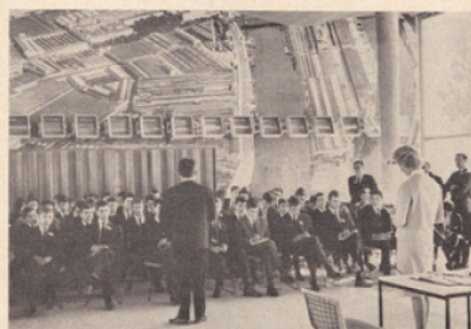
Dans le hall des usines Renault à Flins

tages Pédagogiques ont assuré en parfaite collaboration la direction pédagogique, l'organisation et l'encadrement du voyage.