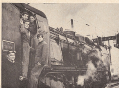
De Lille vers Dunkerque : sur une locomotive de S.N.C.F.

C'est ce journal que l'I.P.N. reçoit en ce moment sous la forme de rapports précis et documentés. Le Service d'Accueil et de Liaison et le Service des Enquêtes et Repor-