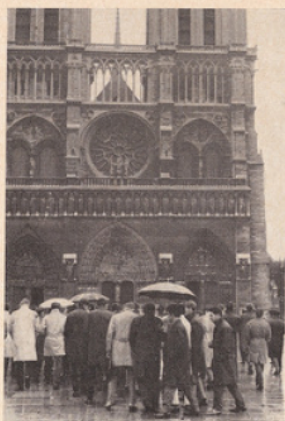
Devant Notre-Dame de Paris