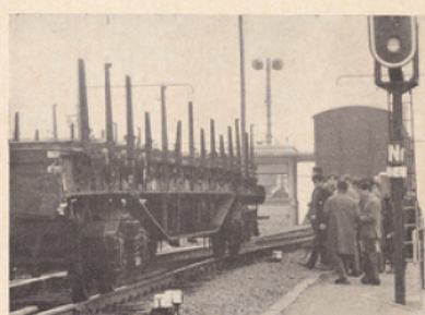
Triage de Villeneuve-Saint-Georges