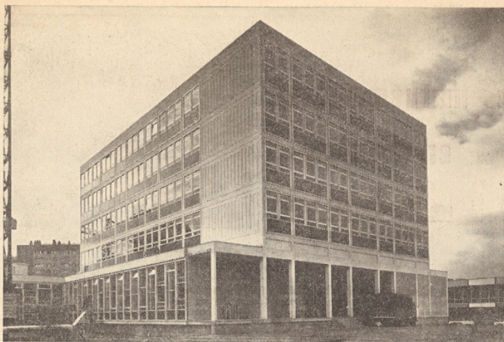
Nanterre : premiers bâtiments.

NANTERRE : la première tranche du futur ensemble universitaire de Nanterre sera mise en service à la prochaine rentrée universitaire. Elle offrira 3 200 places pour les étudiants de propédeutique, deux salles à manger ouvriront le 1 er novembre, la troisième sera achevée en décembre.