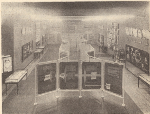
Vue de l'Exposition PASTEUR à Londres.

C'est au Palais de la Découverte que se tint, en novembre 1938, le grand Congrès international commémorant la découverte des ondes hertziennes et du radium. En 1939, la France