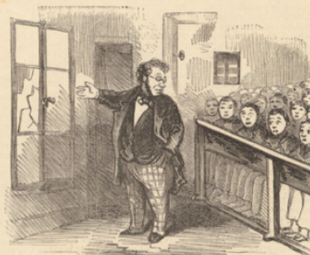
Eh bien, messieurs ! puisque je ne puis savoir qui a cassé le carreau, chaque élève en payera un, et si jamais pareille chose se renouvelle, chaque élève en payera deux.