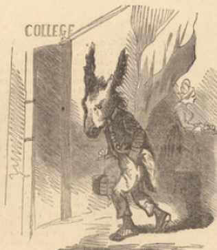
Entrée au collège.