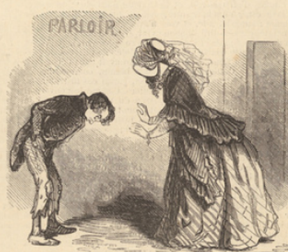
Est-ce possible, grand Dieu ! c'est là le pantalon que je t'ai acheté dimanche.