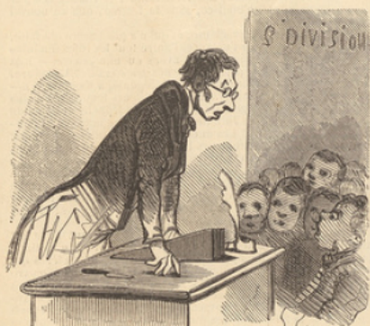
Messieurs, c'est dans quinze jours la fête de votre maître. — C'est cinq francs.