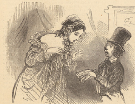
— Mais, maman, je vous assure que je les ai lavés il y a cinq jours.