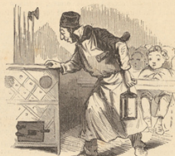
La ration de bois pour toute la journée.