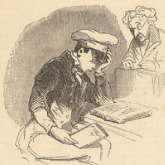
La seconde vue.