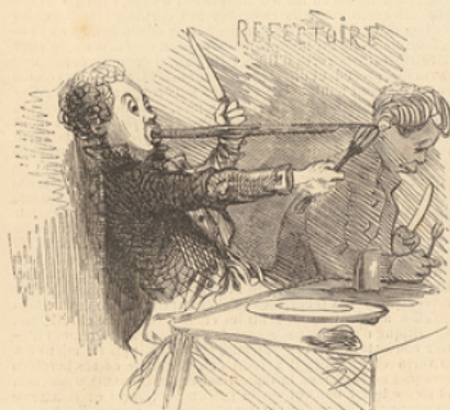
« Une nourriture saine et abondante. » — Extrait du prospectus.