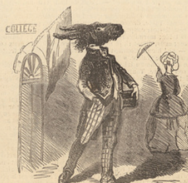
Sortie du collège.