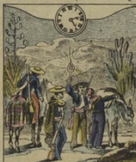
10. à MEXICO. (Mexique). — Il est Cinq heures 14 minutes du matin. Le départ des Muletiers.