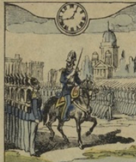
3. à BERLIN. — Il est Midi quarante-quatre minutes. Une revue sur la place Royale.