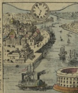
11. à NEW-YORK. (Etats-Unis). — Il est Six heures 55 minutes du matin. Vue de l'entrée du port de New-York.