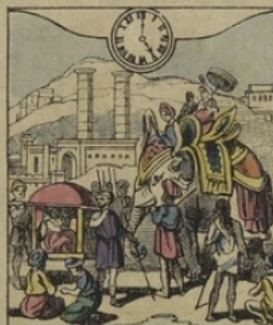
6. à DELHI. (Indes Anglaises). — Il est Cinq heures du soir. Vue de Delhi, ancienne capitale du Grand Mogol.