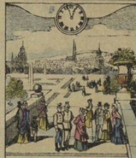
4. à VIENNE. — Il est Midi cinquante-six minutes. La célèbre promenade du Prater.