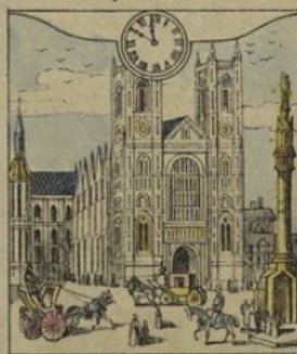
12. à LONDRES. (Angleterre). — Il est Onze heures 50 minutes du matin. Une rue de Londres près de Westminster.