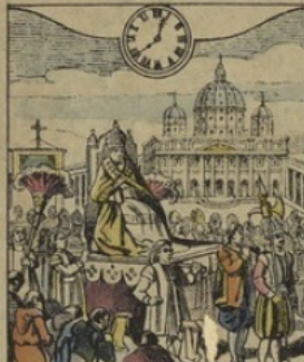
2. à ROME. — Il est Midi quarante minutes. La procession papale sur la place St Pierre.