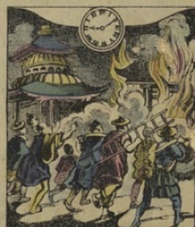
8. à YOKOHAMA. (Japon). — Il est Neuf heures 10 minutes du soir. Un incendie dans le quartier Européen.