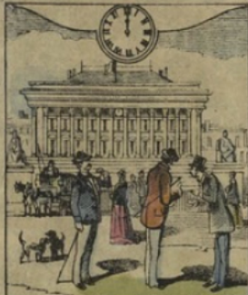
1. PARIS. — Quand il est MIDI à Paris. Vue de la place de la Bourse.

SERIE ENCYCLOPÉDIQUE GLUCQ des Leçons de Choses Illustrées Ouvrage adopté par la VILLE de PARIS comme Récompense dans ses Ecoles.