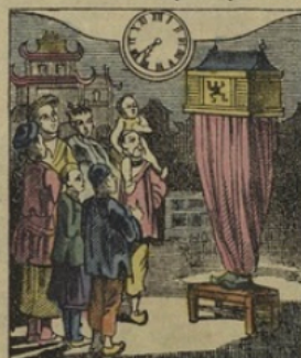
7. à PEKIN. (Chine). — Il est sept heures 37 minutes du soir. L'homme Lanterne-Magique.