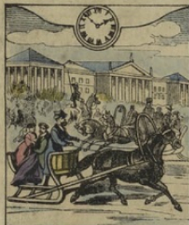
5. à S-PETERSBOURG. — Il est Une heure 02 minutes du soir. La perspective Newsky.