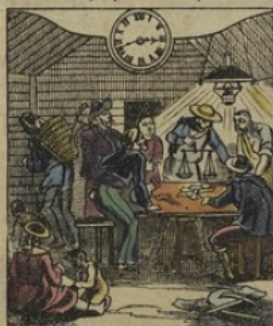
9. à SAN-FRANCISCO. (Californie). — Il est Trois heures 41 min. du matin. Une maison de jeu chez les chercheurs d'or.