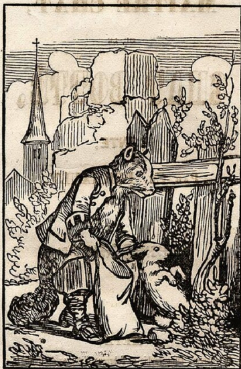
Le Maître Chat, ou le Chat Botté.