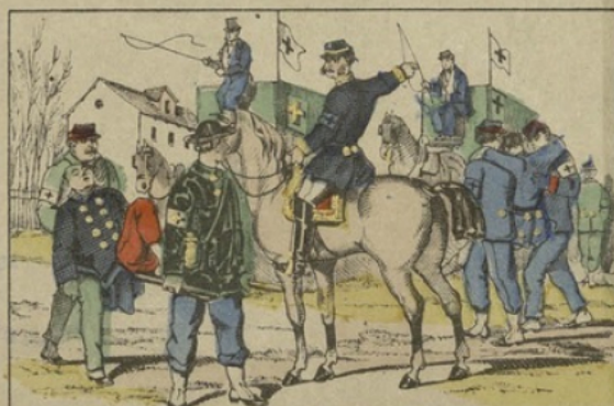
Les ambulances de la presse. Imagerie d'Épinal. — P. LAGRANGE, imp. édit. (Dépôt)