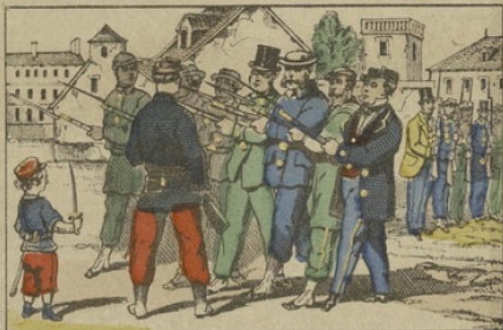
Les gardes nationaux faisant l'exercice.