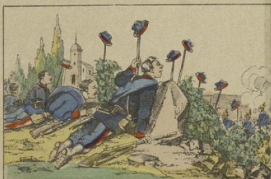
Ruses des mobiles à Argenteuil.