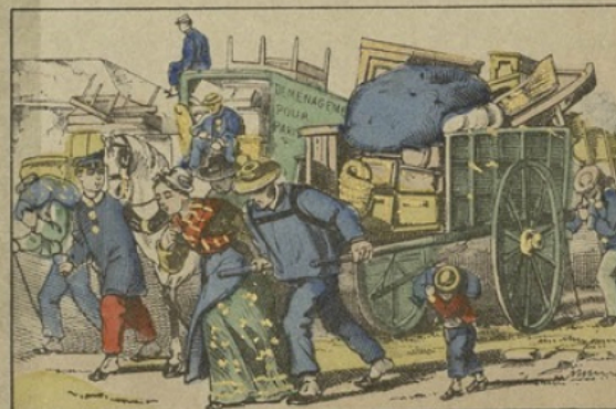
Les gens de la banlieue rentrant dans Paris.