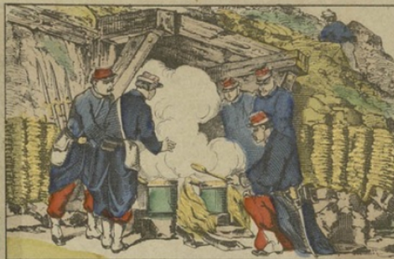
La cuisine dans les casernes.