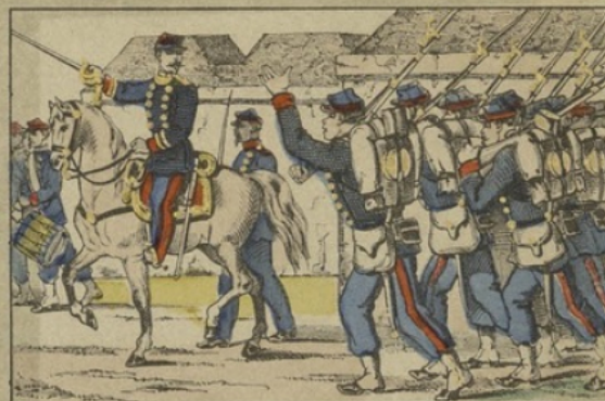
Les gardes mobiles partant pour les avant-postes.