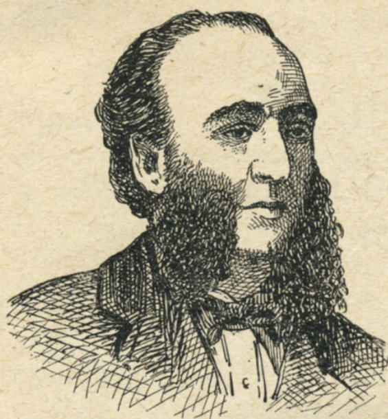
JULES FERRY (1832-1893).

Jules Ferry a deux titres principaux à la reconnaissance des Français ; à son premier ministère se rattachent les plus importantes lois sur l'instruction publique, et c'est lui qui nous a donné la Tunisie et le Tonkin.