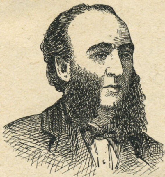
JULES FERRY (1832-1893).

Jules Ferry a deux titres principaux à la reconnaissance des Français ; à son premier ministère se rattachent les plus importantes lois sur l'instruction publique, et c'est lui qui nous a donné la Tunisie et le Tonkin.