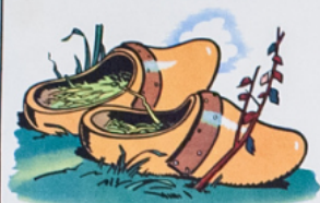
les sa bois de pa pa