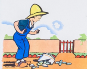
ré mi ca sse sa ta sse