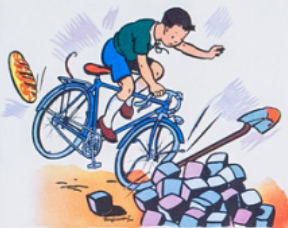
ré m i n'a pas vu le tas de pa v és