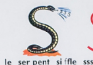
le ser pent si ffe sss