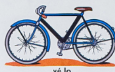
vé l o