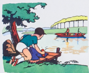
ré m i à la ri v ière la ve l o la cu l otte