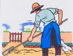
pa pa ra ti sse