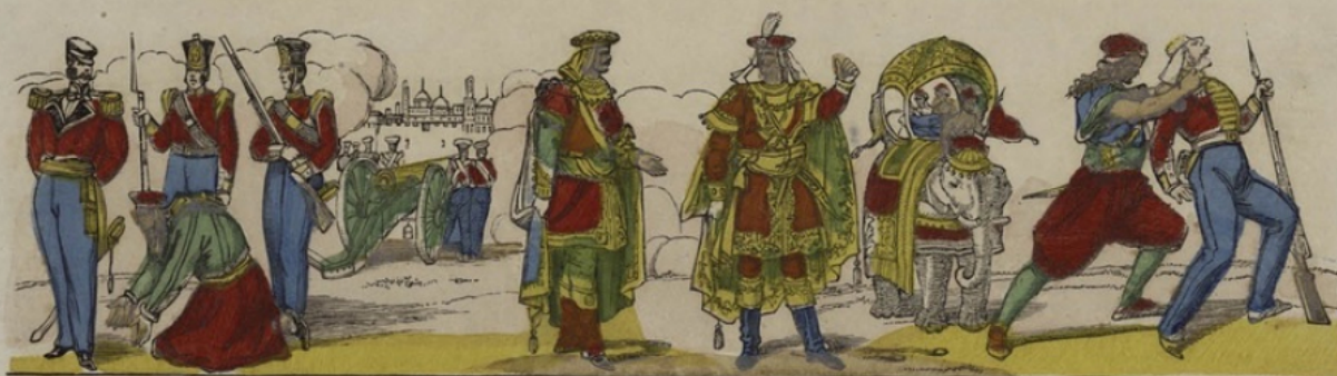
Pendez le... Grâce! je suis innocent!