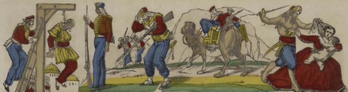
Indien soupçonné d'avoir conspiré