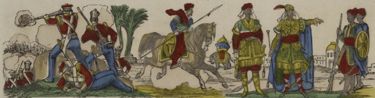
Infanterie anglaise attaquée par les insurgés