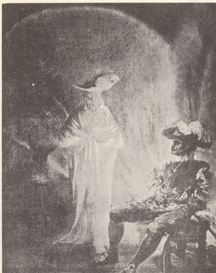
Goya : Don Juan et le Commandeur . Collection de Osuna.