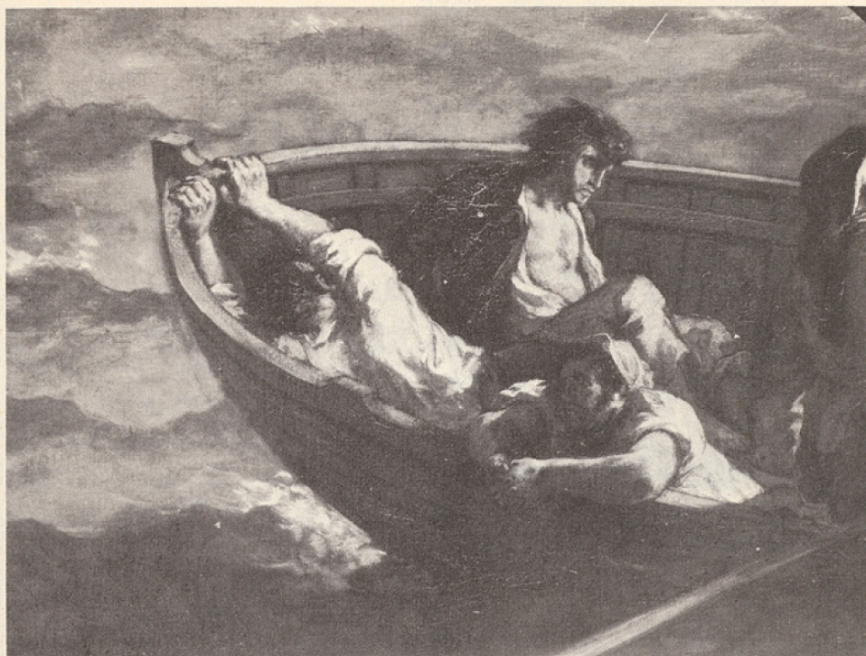
Delacroix : Le Naufrage de Don Juan (détail). Musée du Louvre.