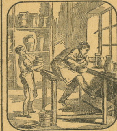
L'ARGILE A POTIER