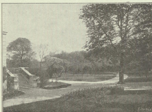
Vue du Parc

Les pensionnaires suivent également au Lycée de Versailles les classes de première supérieure et de mathématiques spéciales qui préparent à l'Ecole Normale supérieure de Sèvres.