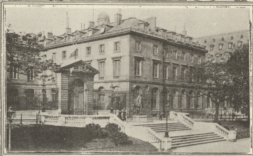
ENTRÉE DU COLLÈGE DE FRANCE, RUE DES ÉCOLES