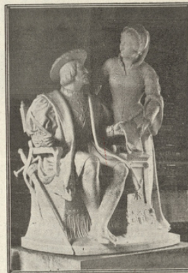
STATUES DE FRANÇOIS I er ET MARGUERITE DE NAVARRE, PAR GUILLAUME