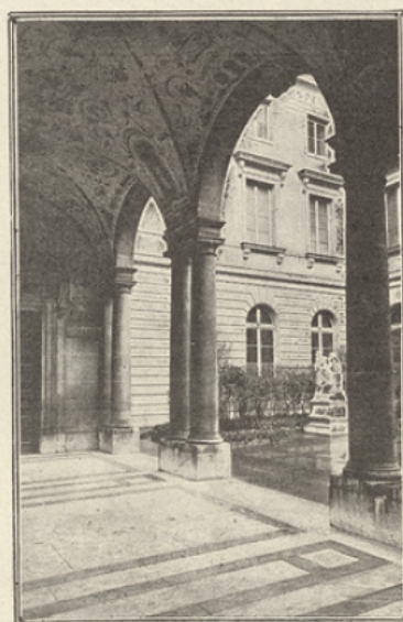
UN COIN DE LA TERRASSE

Cependant, à la mort de François I er , aucun bâtiment ne s'élevait encore et les lecteurs du « Collège Royal » en étaient réduits à faire leurs cours dans des locaux divers ; c'est ainsi que Wattebled (dit Vatable), professa longtemps au collège du Cardinal-Lemoine. Pour remédier à cet