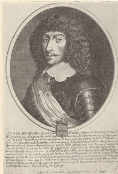
FIG. 11. — Un protecteur de TARTUFFE : Le Grand Condé. (B. N. E.)

49. Le Prince de Condé. Sur sa sollicitude pour Molière et pour Tartuffe , cf. Notice , § I.