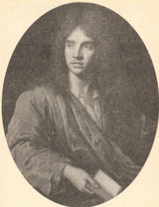
FIG. 1. — Portrait de Molière, par MIGNARD. (Musée Condé, à Chantilly.)

MIGNARD (1610-1695), lié d'amitié avec Molière, a fait de lui plusieurs portraits. Celui-ci, de beaucoup le plus beau, date vraisemblablement de 1667, lorsque Molière, découragé par le demi-succès du Misanthrope et par les batailles de Tartuffe , accablé de chagrins domestiques, était tombé malade et avait quitté le théâtre pendant deux mois. (Cf. Notice biographique .)