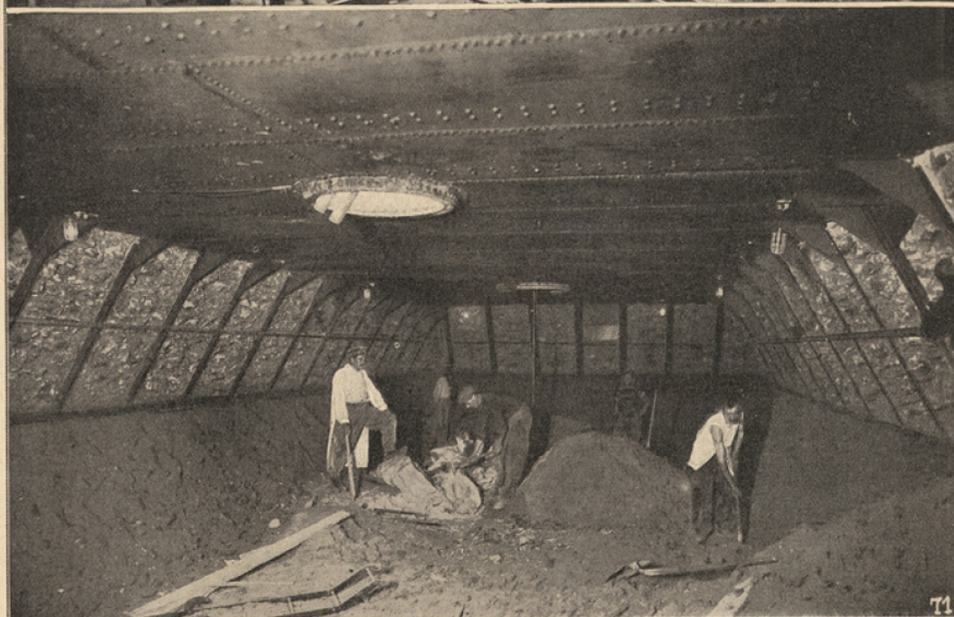
1. Le chantier à ciel ouvert. — 2. Le caisson sous-terrain.