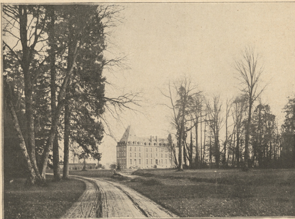
Bâtiment principal du "Collège de Normandie".

Le vieux château fut d'abord transformé et remis à neuf. Il est devenu la première maison d'élèves. Des