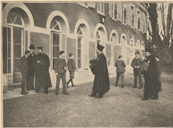
Les études au grand air.

Mais, ce qui frappe le plus le visiteur, au Collège de Normandie, c'est l'emplacement, les arbres séculaires, le charme particulier de ce coin normand, où la nature même se fait éducatrice par l'exemple de l'effort sans cesse renouvelé des sèves, où tout est labeur, où tout vit et chante, exalte et ennoblit.