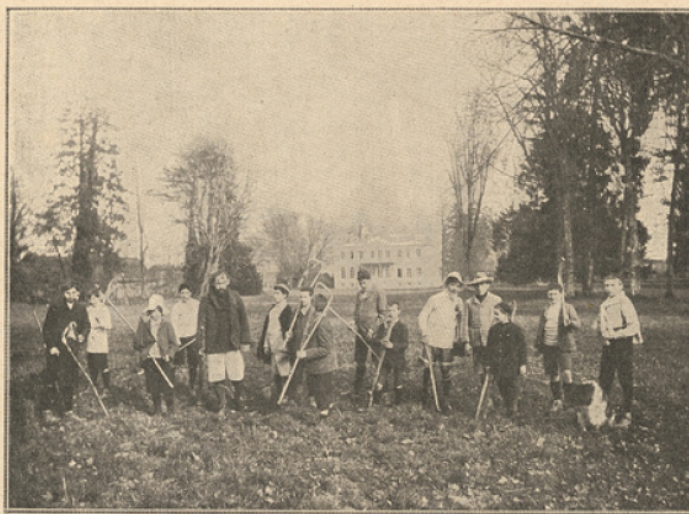
En route pour le jeu.

C'est donc la vie de famille, élargie, il est vrai, mais imitée de près. Aussi, les jours de rentrée, point d'émotion de larmes. En réintégrant sa chambre, l'enfant