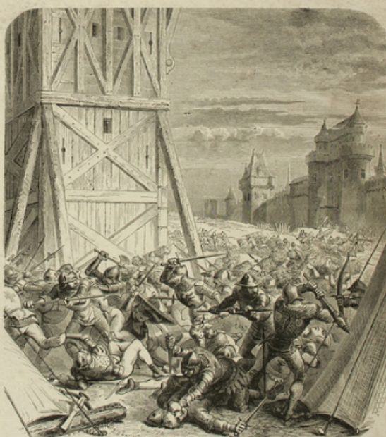
Du Guesclin au siège de Rennes.

Le château de Fougères, situé dans les environs de Redon, était solidement occupé par une centaine d'Anglais, et c'était été folie que de l'attaquer de vive force. Du Guesclin, qui n'avait avec lui que soixante hommes, jura cependant de le prendre; averti que le gouverneur avait commandé du bois de chauffage, il déguisa trente de ses compagnons en bûcherons ou en vieilles femmes, leur fit prendre à chacun une charge de bois, et courut lui-même sous un fagot, il se présenta devant la forteresse, pendant que le reste de sa bande se tenait prêt à accourir; les Anglais sans défiance abaissèrent le pont-levis, mais Du Guesclin, aussitôt entré, se redressa en criant : « En avant », et se précipita sur les Anglais à grands coups de cognac et entouré d'ennemis, criblé de blessures, il est sur le point de succomber, quand ses compagnons arrivent à son secours; les Anglais sont massacrés, et les Français prennent leur place dans le château (1350).