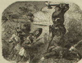
Le Grand Ferré.

Nous devons conserver fidèlement le souvenir de ce pauvre paysan picard appelé le Grand Ferré, qui à lui seul mit en fuite toute une bande de pillards anglais, et qui, malade, se levait de son lit pour assommer ceux qui s'approchaient (1559). Il y eut certainement beaucoup de Grands Ferrés dont l'histoire ne sait pas les noms, et dont les exploits sont demeurés sans gloire. La France, au contact des Anglais, commençait à prendre conscience d'elle-même.