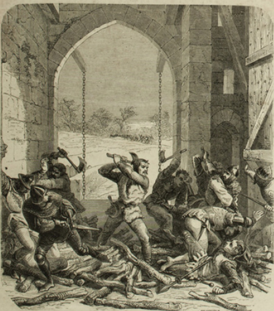
Prise du château de Fougères.