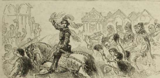
Du Guesclin vainqueur des joûtes.