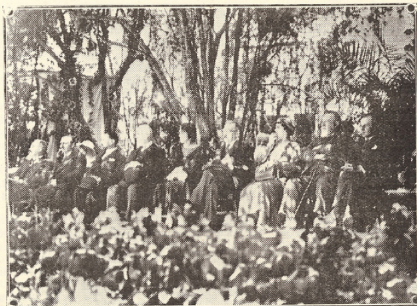
Les Personnalités pendant la Cérémonie officielle

De bonne heure, des groupes se forment dans les magnifiques jardins, sur la terrasse, dans toutes les salles, fleuries et artistement décorées : ce sont d'anciennes élèves, heureuses de se retrou-