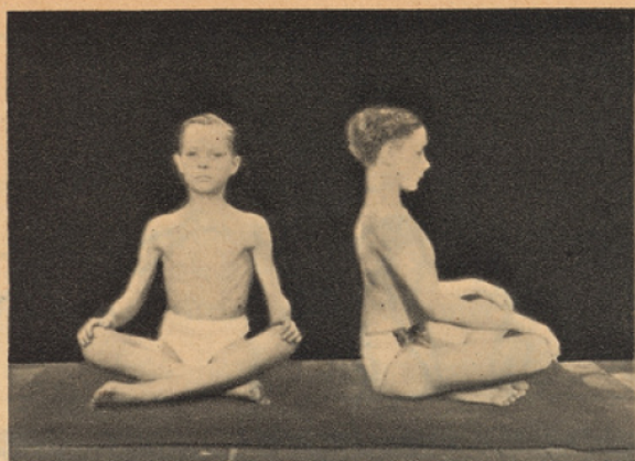
2. Station assise à la "Bouddha"