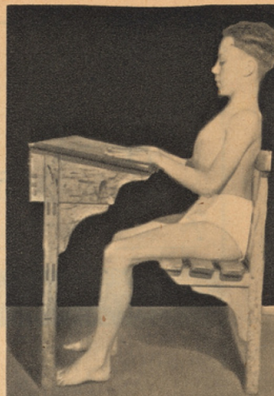
1. Position assise correcte sur le banc scolaire.