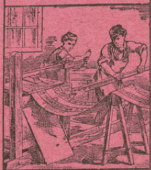
LE PAPIER PEINT