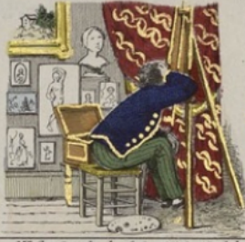
M r Croquant, le plus fort minuscule de la localité se voit, enlever toutes ses ressources et lutte contre l'abus du suicide.