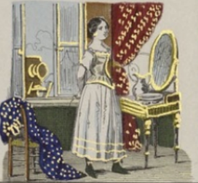
La photographie devient d'une indécision blâmable.