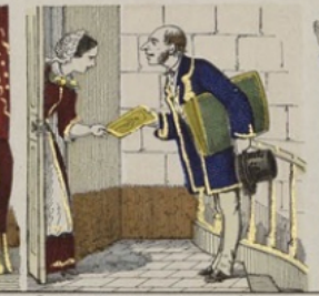
Les cartes de visite au jour de l'an.