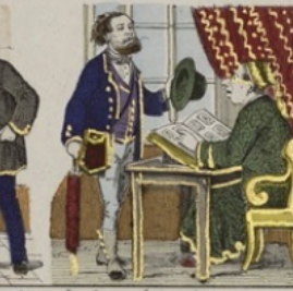
La photographie employée pour constater l'identité des voyageurs.