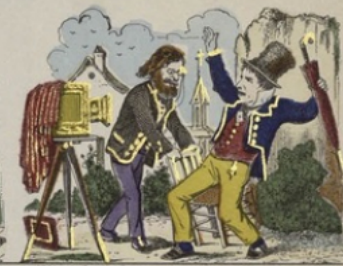
Effet de quelques gens qui ne se rendent pas parfaitement compte du procédé d'exécution.