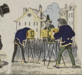
Le monsieur s'en est tellement accablé, qu'il se photographie entre eux, c'est à qui se fera le plus laid.