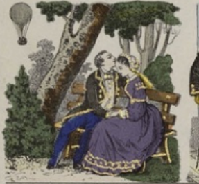
La photographie en ballon.