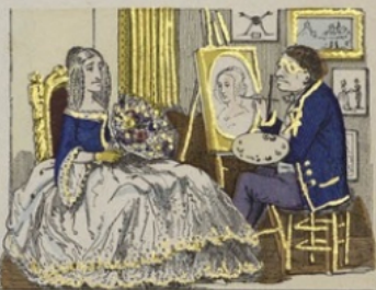
Et M r Croquant qui a pris le parti d'oublier les larmes de grandir les petites d'occuper les trop grandes, continue tranquillement ses affaires.

Imprimerie d'Estampes de Goussier et P. Didot, à Metz. Déposé.