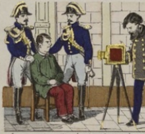
Les gens qui se prêtent le moins volontiers à cet exercice, qui peut les faire reconnaître.