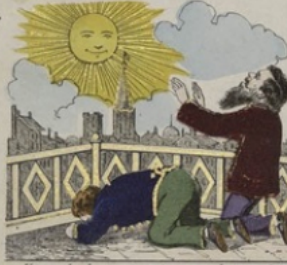
Une seule chose peut nuire aux photographes dans l'esprit des gens pieux : ce lieu comme certain qu'ils adorent le soleil.