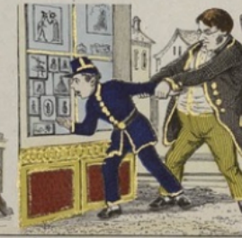
Les gamins s'en moient et toute la génération actuelle refuse toute profession, autre que celle de photographe.