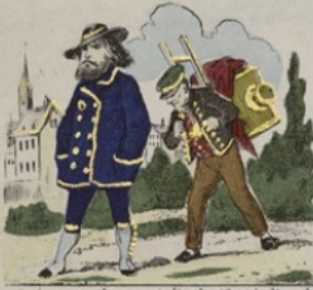
Quel est cet homme à l'air si vil et à la démarche si lourde ? C'est un photographe.