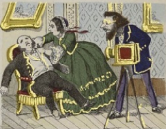
Effet produit sur un monsieur qui a subi plusieurs poses.