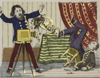
Un monsieur qui sera reproduit dans une attitude peu flatteuse.