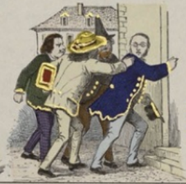
Les esthètes sont poursuivis et traqués par les photographes.