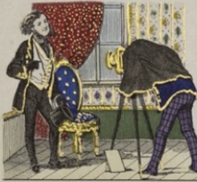
Chacun fait faire son portrait dans l'attitude où il a le plus de grâce.