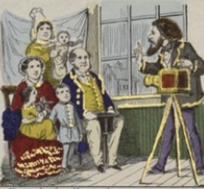
Toutes les familles se font reproduire avec leurs régions en groupe et isolément.