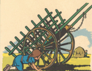
un cha ri oi