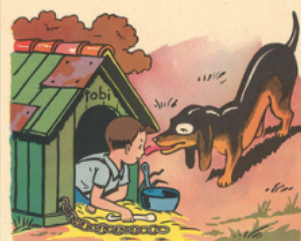
la ni che de to bi