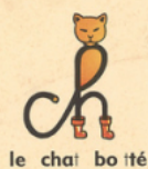
le cha i bo tté