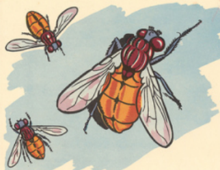
les mou ches

bou che - cou de - moue bou le - gou tte - pou pée