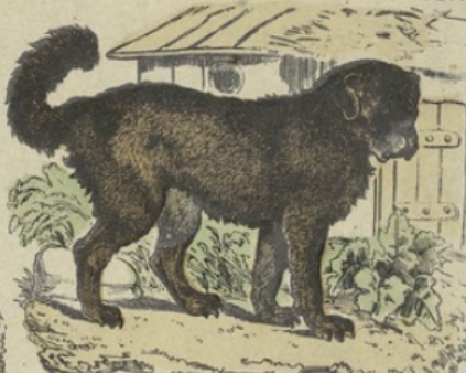
Le Dogue du Thibet.