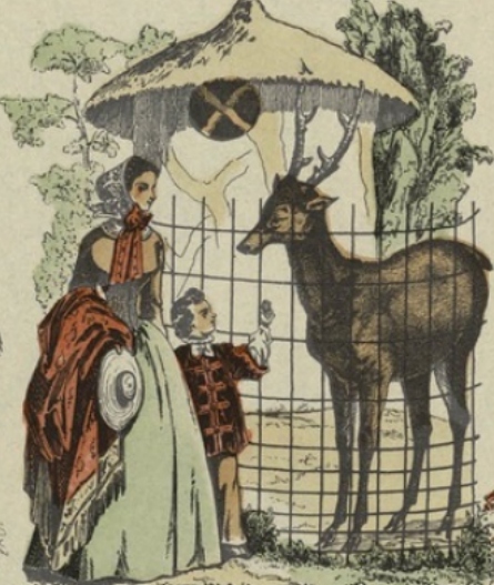
Cabane des Cerfs d'Europe.