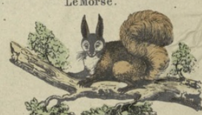
L'Ecureuil du Malabar.