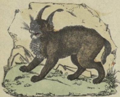
Le Lynx. Loup cervier.