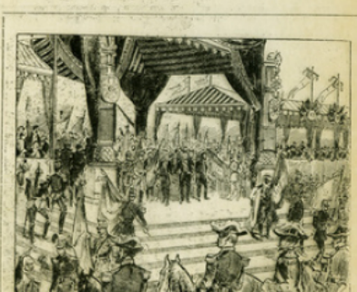
Fig. 12. — La première fête du 14 juillet. Distribution des nouveaux drapeaux à Longchamp (1887) par Jules Grevy, Léon Say et Gambetta.