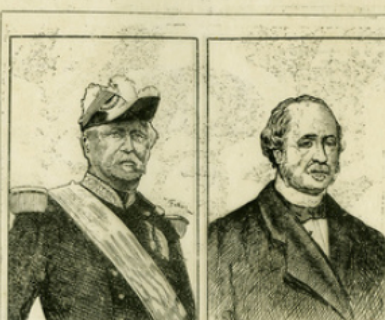
Fig. 11. — Le maréchal de Mac Mahon. — Le duc de Broglie.