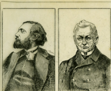
Fig. 7. — Gambetta. — Thiers.