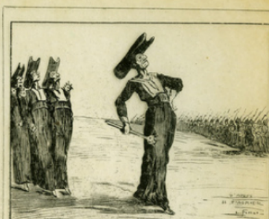
Fig. 9. — L'invasion cédricole succédant à l'invasion prussienne, d'après une lithographie de Daumier parue dans le Charivari.