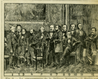
Fig. 6. — Le gouvernement de la Défense Nationale : 1) Emile et Arago ; 2) Rochefort ; 3) Ad. Crémieux ; 4) Glais-Bizoin ; 5) Ernest Picard ; 6) Le général Trochu, président ; 7) Léon Gambetta ; 8) Gaston-Pagès ; 9) Jules Favre ; 10) Jules Simon ; 11) Jules Ferry ; 12) Eugène Pelletan.