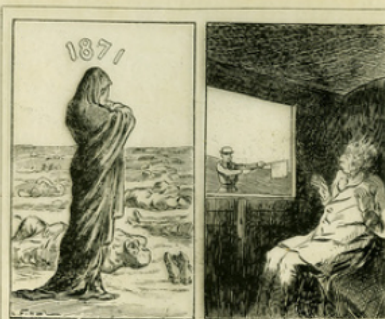
Fig. 8. — Deux dessins de Daumier. L'un représente la France en deuil devant la quantité de morts de l'année 1871 ; l'autre le trois-porte-drapeau ; un drapeau se rendant à Versailles recueilli d'effroi à la vue du drapeau rouge d'un garde-barrière.