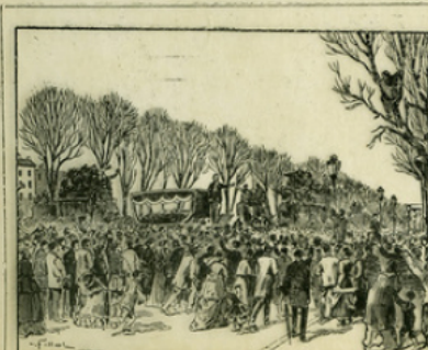
Fig. 4. — Aux obélisques de Victor Noir, tiré par Pierre Bonaparte, la foule manifeste contre le gouvernement impérial.