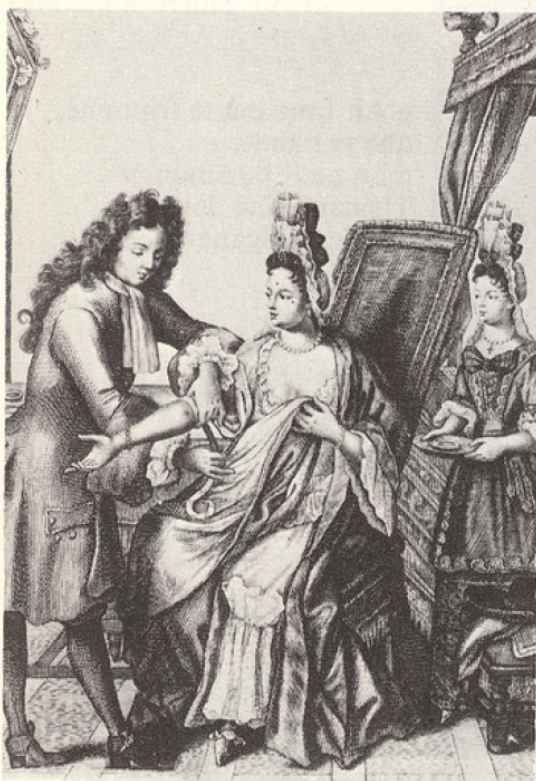
1 Cabinet de consultation du médecin Debeux. Gravure d'après L'Almanach du temps .