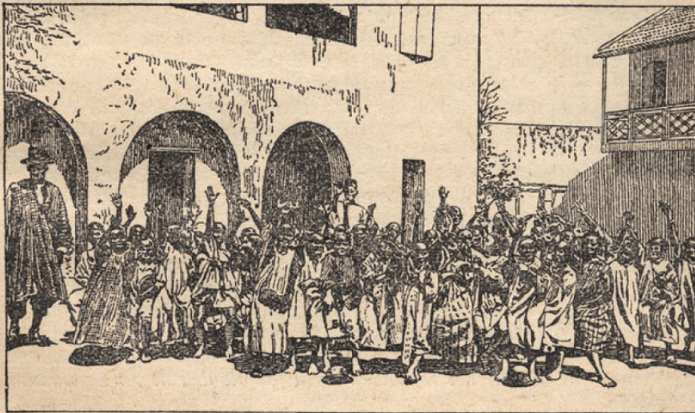
Fig. 444. — UNE ÉCOLE INDIGÈNE (GORÉE), d'après une photographie.

trie algérienne a été rénovée par les ateliers-écoles. Partout la France a entrepris d'instruire les indigènes et de leur enseigner notre langue. L'amusante fig. 444 nous montre des négrillons du Sénégal répétant en français après leur instituteur, un noir également : « Je lève le bras. » Ainsi, peu à peu, les peuples « associés » à notre œuvre de civilisation, deviennent des « Français ».