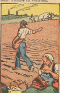
La France, débarrassée du Cartel, redevient prospère. Elle fait confiance à Poincaré pour régler au mieux les intérêts du Pays, les grandes questions des dettes interalliées et des Réparations. Si les électeurs savent désormais écartier.