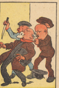
Voyant la situation financière rétablie, les cartellistes ont voulu faire le coup du père François à Poincaré en forçant Herriot et Sarraut à démissionner. Mais leur manœuvre d'Angers s'est retournée contre eux.