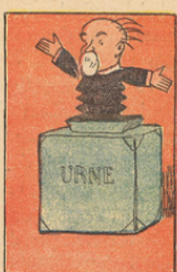
Au mois d'avril 1928, le Pays, reconnaissant à Poincaré de l'avoir sauvé une fois de plus, envoya à la Chambre une majorité d'Union Nationale. Radicaux, socialistes et communistes furent battus. Poincaré fut victorieux.