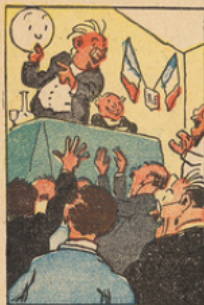
Le Cartel radical et socialiste, ayant promis aux électeurs la vie moins chère, le franc plus haut, des augmentations de salaires et la lune, fut vainqueur aux élections de 1924.