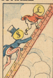
Le Gouvernement, pressé par ses créanciers, tapait dans les avances de la Banque de France. La livre grimpa et le dollar faisait comme elle.