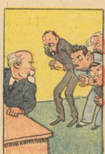
Le Cartel s'effondra sous la colère populaire et ses chefs appelèrent à leur secours Poincaré contre lequel ils avaient mené 18 mois plus tôt, la plus ignoble campagne.