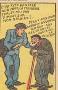
Poincaré, revenu au pouvoir, gouverne aujourd'hui sans eux. Il a fait voter la loi des assurances sociales et exonéré dans le budget de 1929 des milliers de petits contribuables-ouvriers de l'impôt sur les salaires.