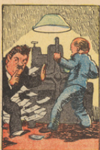
Le Trésor ayant atteint la limite des avances autorisées de la Banque de France, le Gouvernement fit tirer des billets clandestinement, et comme il fallait masquer l'opération, on imposa à la Banque la publication de faux bilans.