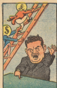
Les élus cartellistes clamèrent : « Nous voulons les places, toutes les places et tout de suite ! ». La livre, un peu émue, grimpa à l'échelle des changes, suivie par le dollar.