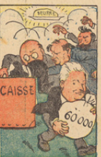
A défaut de l'assiette au beurre qu'ils n'ont pu ressaisir, les cartellistes, malgré l'opposition des nationaux, se sont augmentés une seconde fois : ils ont porté leurs appointements à 60.000 francs.