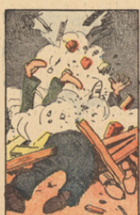
Ayant ainsi crevé le plafond, M. Herriot et ses collègues furent écrasés sous les plâtres. Les gouvernements se succédèrent alors au rythme de deux par mois.