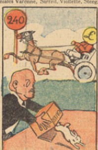
Vint le jour où le dernier « ne » dut avouer que les caisses étaient vides, et qu'il faudrait, le lendemain, déclarer la faillite de l'Etat. La livre arrivait dans un fauteuil à 240.