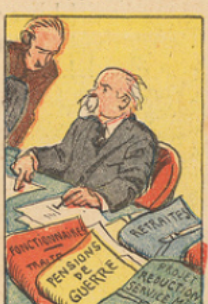
Le Gouvernement d'Union Nationale, au lieu de faire des promesses, accomplit des actes. Il a augmenté les fonctionnaires, les pensionnés de guerre et les retraités. Il a réduit à un an la durée du service militaire.