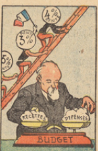
Pour la première fois, depuis le Cartel, Poincaré établit un rigoureux équilibre du budget. Il fit redescendre la livre de 240 à 124 et stabilisa le franc à ce niveau. Les rentes remontèrent à vive allure.