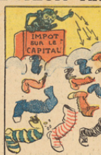
Cependant, la menace de l'impôt sur le capital faisait friser les bas de laine.