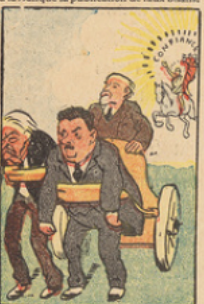
Poincaré, magnanime, attela à son char les chefs du Cartel et les sauva du mépris public. La confiance, qui s'était enfuie, revint au triple galop.