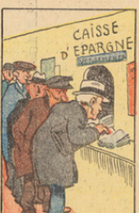
Il a consolidé la dette flottante. Les porteurs de bons n'en exigent plus le remboursement et les caisses d'épargne se remplissent de nombreux milliards.