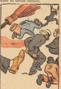
aux élections municipales et législatives les politiciens de gauche qui l'avaient conduit à l'Alamo, elle connaît des jours heureux et pourra s'attacher davantage au progrès social qui n'est possible que dans la tranquillité et la prospérité.